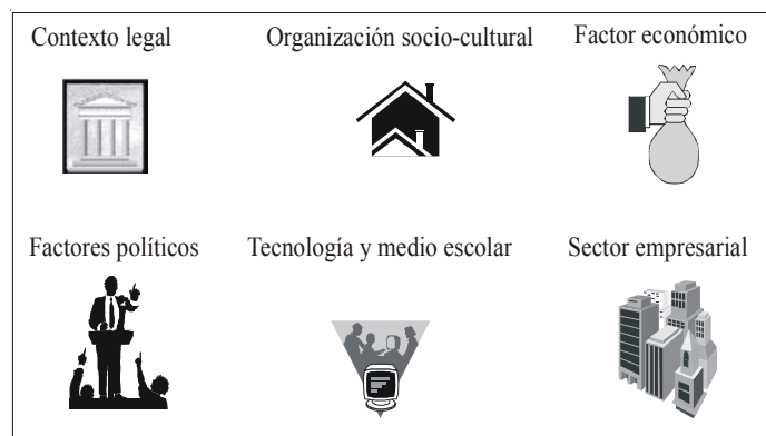
Figura 5. Elementos que forman parte del entorno de una empresa

Fortin (1992), en su modelo de red, ubica la empresa en un entorno. Éste cambia continuamente y la empresa debe actuar y moverse en él; para esto tendrá que trabajar con el fin de desarrollar su capacidad de predecir los cambios que han de gestarse en el ambiente en el cual actúa (Figura 5).